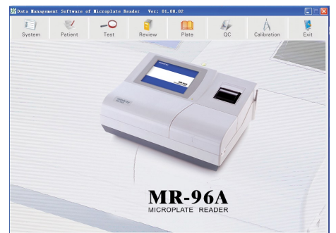
Программа обработки результатов